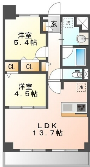
間取図が現状と異なる場合、現状を優先します。