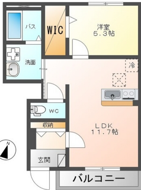
間取図が現状と異なる場合、現状を優先します。