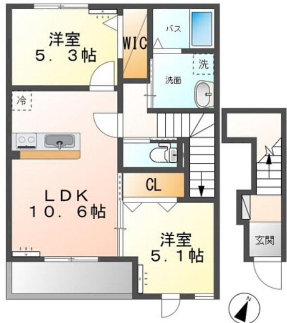
間取図が現状と異なる場合、現状を優先します。