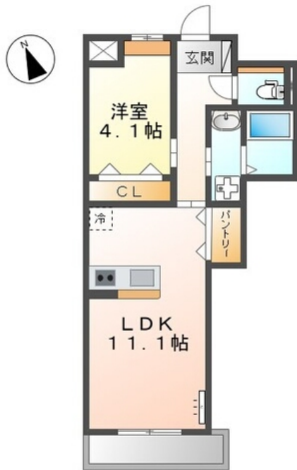
間取図が現状と異なる場合、現状を優先します。