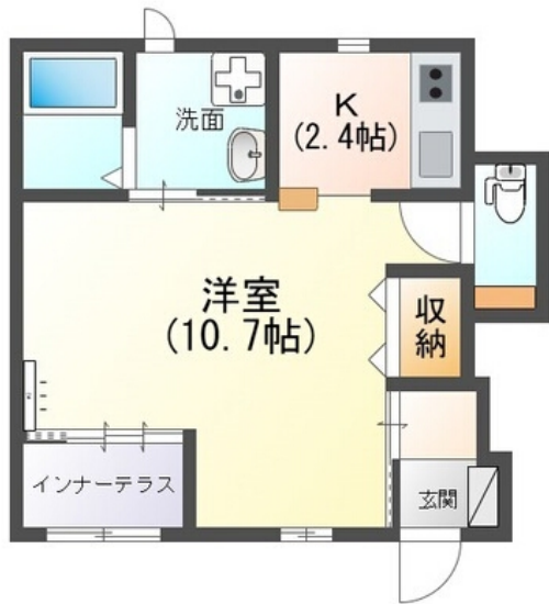
間取図が現状と異なる場合、現状を優先します。