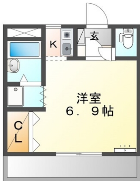
間取図が現状と異なる場合、現状を優先します。