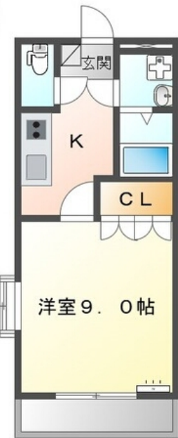
間取図が現状と異なる場合、現状を優先します。