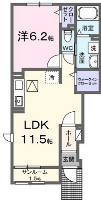
間取図が現状と異なる場合、現状を優先します。