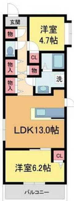
間取図が現状と異なる場合、現状を優先します。