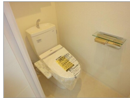
シャワー付トイレ