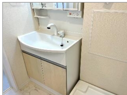
洗顔洗面化粧台(イメージ)