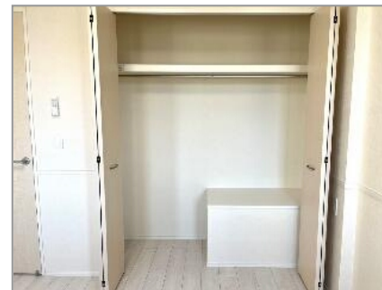
クローゼット(イメージ)