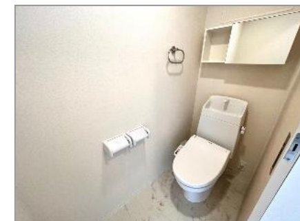
シャワー付トイレ(イメージ)