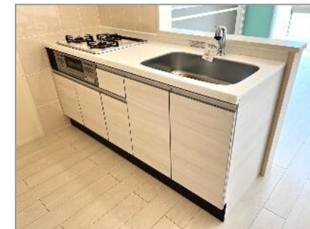
キッチン(イメージ)