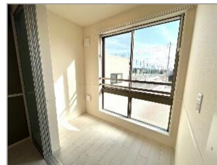
インナーテラス(イメージ)