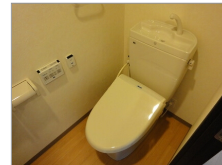
シャワー付トイレ