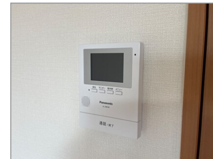
カメラ付インターホン