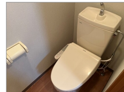
シャワー付トイレ